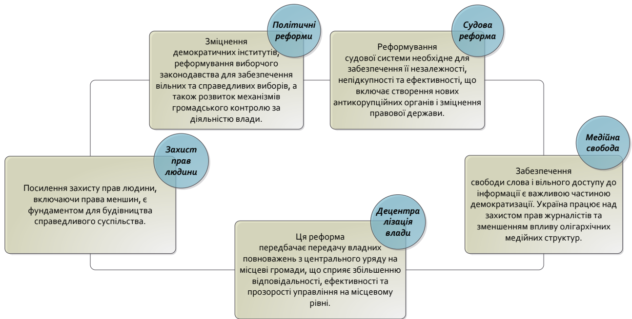
Рис. 1. Основні кроки на шляху до демократизації в Україні

4) свобода преси та інформація: 5) міжнародна підтримка. Тож, демократизація в Україні почала набирати обертів після розпаду СРСР, коли Україна здобула незалежність. Перший значний крок до демократизації був зроблений з прийняттям нової Конституції в 1996 році, яка заклала основи для розділення влади, багатопартійної системи та прав людини.